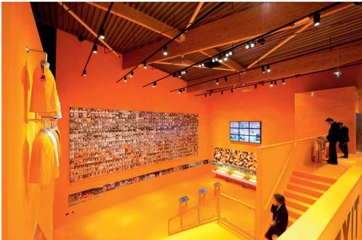
FOTO BOVEN Voetbal Experience Middelburg. Ontwerp DST Experience Communicatie