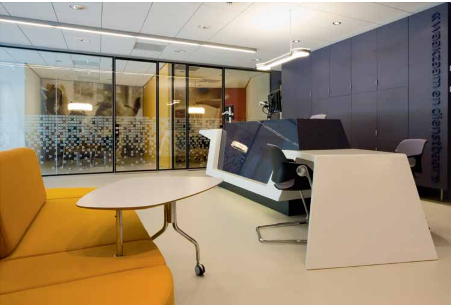
FOTO BOVEN Interieur Politiebureau Texel, ontwerp Dedato Ontwerpers en Architecten