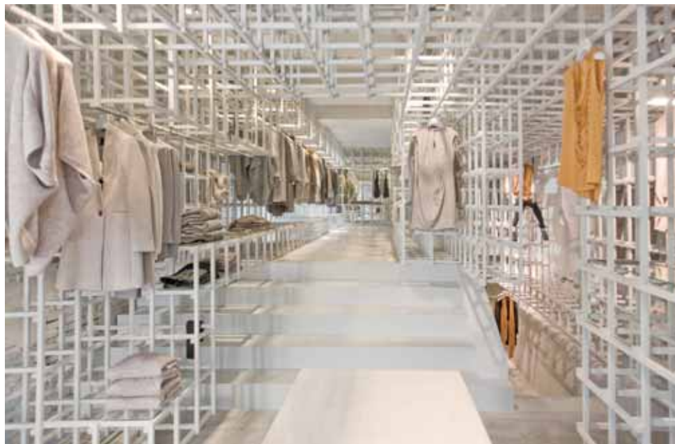
FOTO ONDER Interieur Stills, Amsterdam. Ontwerp Doepel Strijkers Architects