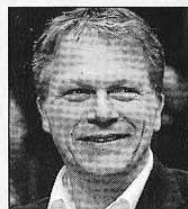
■ Vice-premier Wouter Bos ...zo moet het...