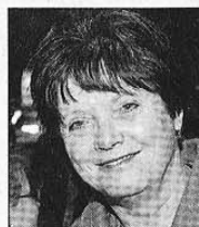
■ Minister Ella Vogelaar ...al eens geweest...