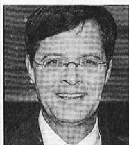
■ Premier Jan Peter Balkenende ...voorbeeld...

Vanochtend neemt hij het halve kabinet op sleeptouw naar de meest besproken wijk van ons land: Slotervaart. De wijk staat bekend om relschopende Marok-